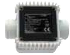
K24 Pulse-meter Flow rate up to 100 l/min Accuracy \pm 1\% Pulse out 100 p/l

DE Dieser Literzähler lässt sich leicht an der Leitung oder am Ende des Druckschlauchs anbringen und verfügt über ein kompaktes, gut ablesbares Display. Der Literzähler kann auch direkt an der Zapfpistole angebracht werden. Das Display wird durch zwei, leicht austauschbare Batterien gespeist und lässt sich in 4 verschiedene Stellungen drehen. Signale und Impulse: Einzelkanal, Reed-Schalter. Platine mit LCD-Display: 5-stellige Teilmenge von 0.1 bis 99999, 6-stellige Gesamtmenge von 1 a 999999. Erhältlich mit rückstellbarer Gesamtmenge. Durchflussanzeige.