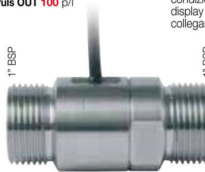
Inline pulse meter

Accuracy \pm 1\% Possibility of calibration. Flow rate up to 40 l/min Puls OUT 100 p/l